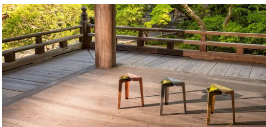
La silla "Orisu" es algo especial: convierte tecnologías abstractas en algo visible para el observador.