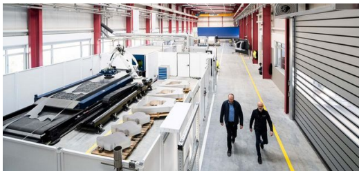
La instalación de Laser Blanking de 34 metros de largo ahorra materia prima y unas 4000 toneladas de CO2 cada año.