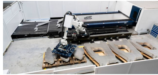
Laser Blanking: un robot clasifica de forma automática los componentes cortados.