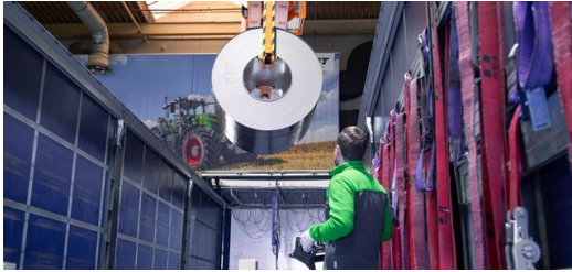
Una grúa sustituye ahora a cinco carretillas elevadoras, lo que supone un enorme aumento de la productividad.