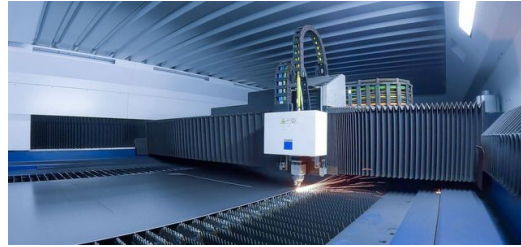
El cabezal láser se desliza sobre la aparentemente interminable banda de chapa y corta los contornos de las partes exteriores de la superficie exterior de los tractores Fendt.