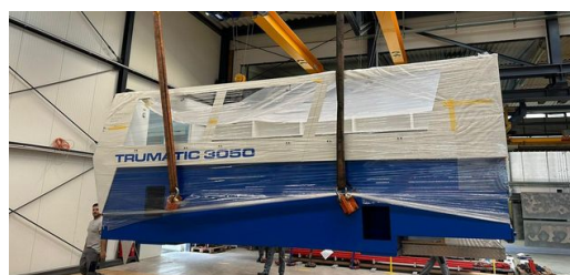
Carga pesada: la barra de siete toneladas al llegar a la nave de montaje de la empresa Matussek Metalltechnik.