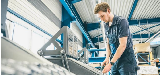
<p>La TruMatic 7000 corta y da forma a las chapas estriadas de aluminio para las máquinas EGYM sin arañazos y con la mejor calidad.</p>

láser, pasando por una célula de plegado, Steinhart ofrece toda la gama de mecanizado de chapa. «Aquí solo apostamos por máquinas de TRUMPF», explica Genkinger y añade: «En la construcción del bastidor para el primer EGYM, nuestro profundo conocimiento en el área del corte de tubos por láser nos ha ayudado especialmente». El varillaje del bastidor de la máquina está formado en hasta un 70 por ciento de tubos ovals ópticamente atractivos a partir de acero de construcción estable. «Para el mecanizado empleamos tanto nuestras TruLaser Tube 5000 como TruLaser Tube 7000 . Ambas están equipadas con la opción de corte biselado y pueden colocar roscas». Lo que en la fabricación convencional solo sería factible en varios pasos de trabajo lo hacen las máquinas de corte de tubos por láser de TRUMPF en solo una fase de trabajo. La chapa estriada de aluminio para reposar los pies sale sin arañazos de la TruMatic 7000 , el borde de plegado necesario para la fijación en el bastidor lo realiza la TruBend 7036 Cell . Steinhart recibe el suministro de los sistemas electrónicos y algunas piezas de plástico. Tras el recubrimiento de polvo del bastidor se realiza el montaje de todos los componentes en unidades completas.