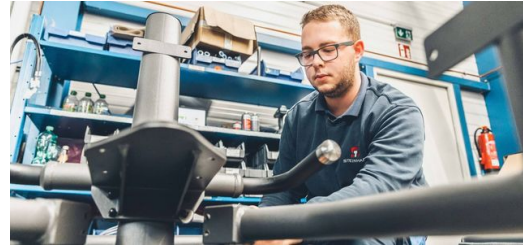
<p>Las barras de una máquina deportiva EGYM están compuestas sobre todo por tubos de acero ovalados. Tras el mecanizado en una máquina de corte de tubos por láser TRUMPF recibe un recubrimiento de polvo en un elegante acabado gris oscuro.</p>