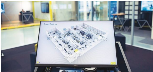
Los datos de las máquinas que TRUMPF recoge en su Smart Factory ayudan al equipo de Computer Vision a entrenar la IA.

En este modelo de negocio, el buque insignia completamente automatizado de la empresa de alta tecnología se encuentra en la nave del cliente y produce allí las piezas necesarias, pero un equipo de TRUMPF en Neukirch, en Sajonia, se encarga del control en tres turnos, también por la noche. Las cámaras permiten al equipo observar el interior de la máquina y obtener datos de forma ininterrumpida. Si se atasca una chapa, las cámaras graban un clip de vídeo desde unos segundos antes hasta unos segundos después. Esto, a su vez, permite entrenar la IA para evitar esos errores en el futuro. Una utilización más eficiente de las máquinas, tiempos de funcionamiento más largos, mayores cantidades de piezas, ahorro de material, predicciones de mantenimiento, sistemas de asistencia... Las posibles aplicaciones de la IA son diversas y son solo el comienzo. «Ahora mismo están pasando muchas cosas en el campo de Visión», afirma Korbinian Weiß, y espera con impaciencia el año 2024. Por ejemplo, las cámaras inteligentes, en las que incluso se utiliza IA, pronto serán importantes en las máquinas de TRUMPF.