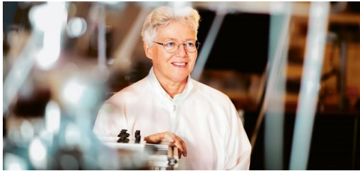
La catedrática Anne L'Huillier abrió en su día la puerta a la física de los pulsos láser de attosegundos. Con sus investigaciones, ahora estrecha el cerco sobre los electrones.

L'Huillier: Es difícil ofrecer una visión bien definida. Se trata de investigación básica.