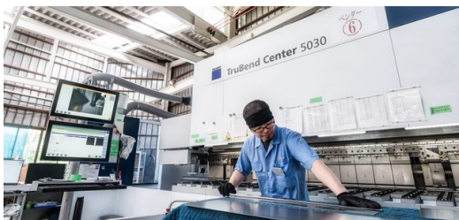
Un trabajador opera la TruBend Center 5030 : así se fabrica la silla "Orisu".