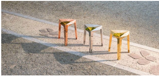
La silla "Orisu" en diferentes colores: un objeto simétrico fabricado con piezas uniformes y plegado en metal como en la técnica origami.