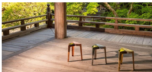
La silla "Orisu" es algo especial: convierte tecnologías abstractas en algo visible para el observador.