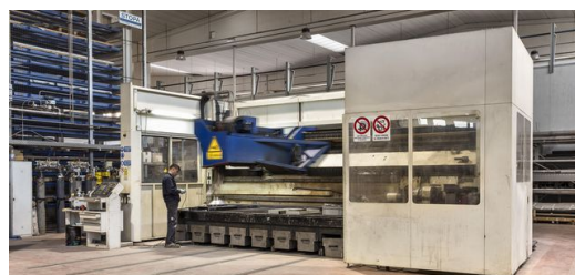
Multitalent: Mit der Lasercell 1005 schweißt und schneidet ELFIM nicht nur 2-D- und 3-D-Bauteile, sie eignet sich auch fürs Laserauftragschweißen.