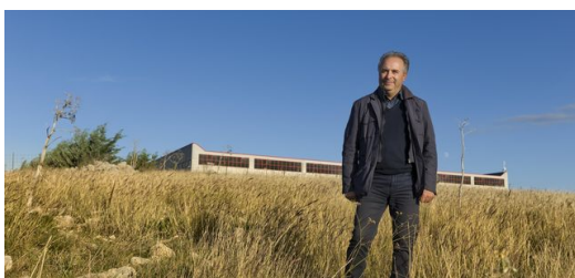
Das Unternehmen ELFIM S.r.l. befindet sich auf einer kargen Hochebene bei Gravina in Puglia.

Dabei handelt es sich fast immer um Einzelstücke, 12 Stück waren bisher das größte Los für ELFIM: „Mit dem LMD-Verfahren fertigen wir Komponenten, die sich entweder nicht anders herstellen lassen oder deren Produktion mit alternativen Verfahren bei so kleinen Losgrößen viel zu teuer wäre. Zum Beispiel weil man vorher erst aufwendig eine Gussform oder andere Werkzeuge bauen müsste“, erläutert D’Alonzo.