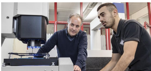
Ersatzteile für Oldtimer sind rar. Per LMD-Verfahren lassen sie sich kostengünstig rekonstruieren. Dafür scannen die Experten bei Elfim die