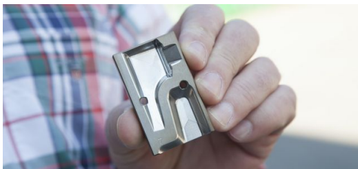
Der Formgreifer zwingt die Rohlinge in eine definierte Lage und damit ins Bezugssystem der Lasermaschine.