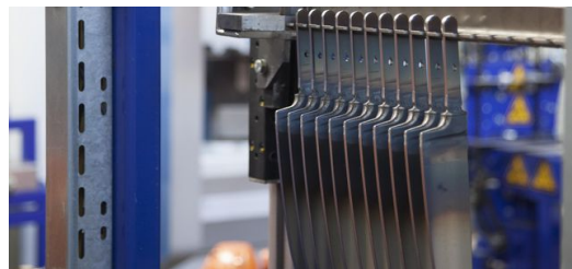
Nach dem Konturschneiden warten die Klingen auf das Stiften, Schleifen und Härten.