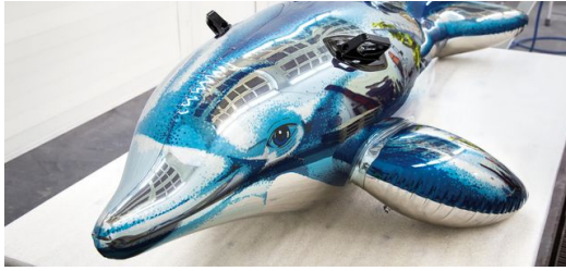
Statt im Wasser ist dieser Delfin im Museum anzutreffen.