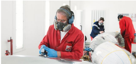
Das handwerkliche Know-how aus der Lohnfertigung nutzt Arnold auch im Kunstgeschäft.