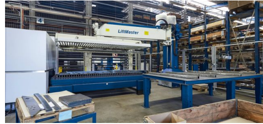
Ein Stopa-Hochregallager sorgt bei Schickling für Materialnachschub, ein LiftMaster für leichteres Teilehandling.