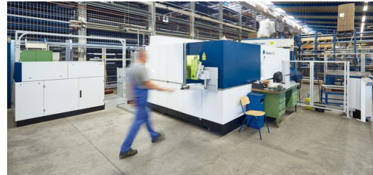
Die Maschine wurde aufgestellt und läuft seitdem absolut reibungslos. „Besser geht's nicht“, schwärmt Hermann Schickling.