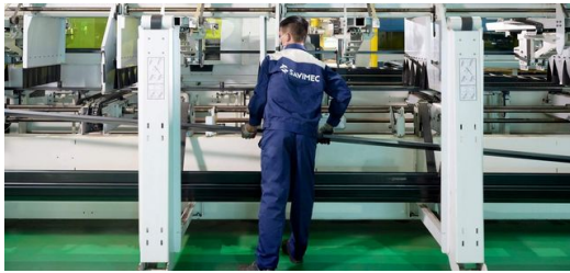
In Vietnam ist die Nachfrage nach Laser-Rohrschneidern in den vergangenen Jahren gestiegen. Mit der TruLaser Tube 5000 fiber bedient SAVIMEC den wachsenden Markt.