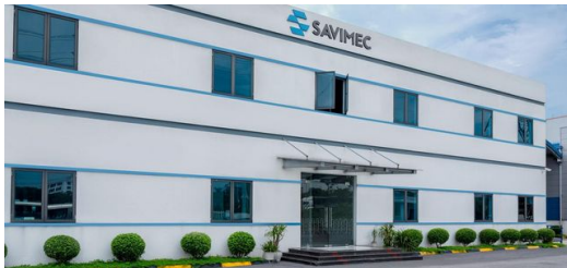
SAVIMEC produziert in einer 12.000 Quadratmeter großen Produktionshalle inmitten des wichtigen Wirtschaftsdreiecks Hanoi, Quang Ninh und Hai Phong.