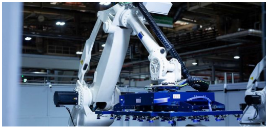
Die zwei Entladeroboter haben gut zu tun: Die Bauteile kommen in Strömen aus der Laserschneidkammer.