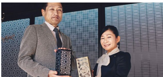
Bestseller: Windlichter mit komplexen geometrischen Mustern – jedes davon ein Unikat.