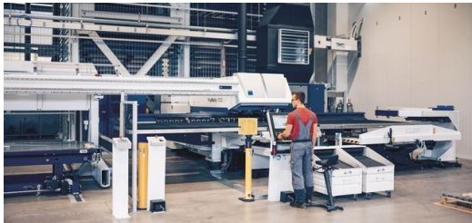
Schweißen, stanzen, biegen: TRUMPF Maschinen sorgen bei Elpro für höchste Teilequalität, Produktivität und Flexibilität.