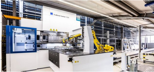
Die TruBend Center 7020 mit StarMatik Roboterautomatisierung ist an das vollautomatische STOPA Lager angeschlossen. Nur für die Bereitstellung neuer und den Abtransport beladener Paletten sind Mitarbeiter notwendig.