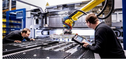
Bei Autz + Herrmann werden vorwiegend dünne Bleche verarbeitet. Die Niederdruck-Saugnapfe der StarMatik Roboterautomatisierung nehmen Platinen besonders materialschonend auf.