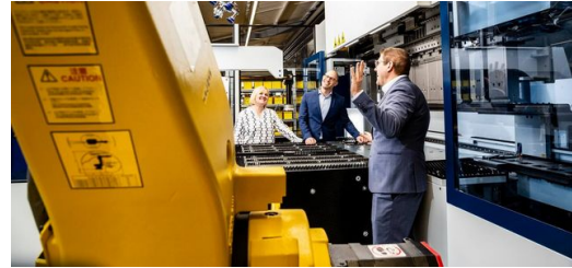
Die StarMatik Roboterautomatisierung zum Be- und Entladen der TruBend Center 7020 bringt Tempo in die Produktion.