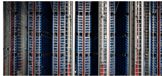
Innovative Lagerlösungen – ein System, das täglich im Schnitt 3.500 Picks ermöglicht.