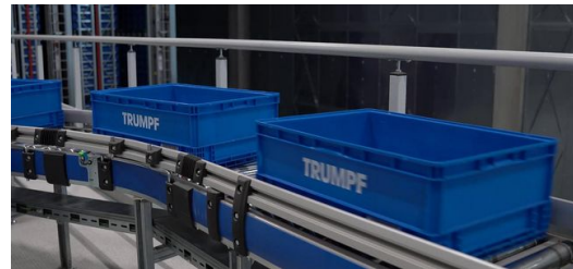
Die ersten Meter auf dem Weg zum Kunden: Die Kunststoffbehälter haben bis zu vier Einsatzkästen für Kleinteile.