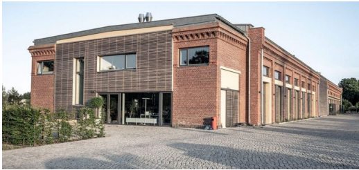
Bei Miethke in Potsdam entstehen Hightech-Medizinprodukte, die in den Kopf eingesetzt werden.

Das Thema Oberfläche lässt Gleumes seither nicht mehr los. „Zurzeit experimentieren wir damit, mit dem Laser hydrophobe und hydrophile Oberflächen für unsere Teile zu schaffen. Es ist so: Wenn man schon mal einen Ultrakurzpuls laser im Haus hat, fallen einem immer mehr Dinge ein, die man damit machen kann.“