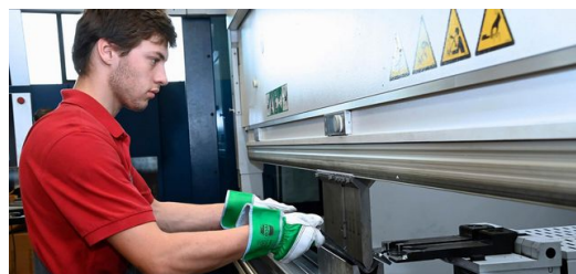
Assistenzsysteme und Software helfen bei der Arbeit: Die TruBend 5230 im