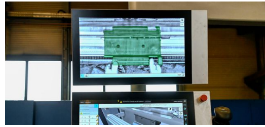
Zeigt der Part Indicator grün, ist das Biegeteil richtig eingelegt. Dank dieser Funktion konnte Fischer Maschinenbau den Ausschuss in der Blechtechnik minimieren und die Schnelligkeit erhöhen.