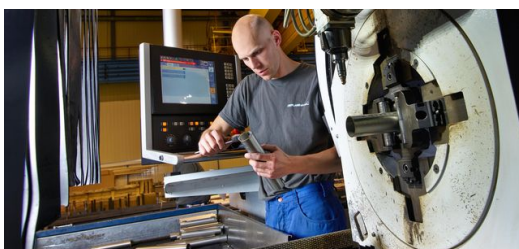
Täglich sind ein bis zwei Programmierer mit der Vorbereitung von zwei Schichten beschäftigt. Die Software TruTops Tube ermöglicht die exakte Berechnung von Schnittgeometrien.