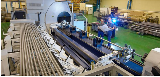
Im 3-D-CAD-System von TRUMPF stehen zahlreiche Konstruktionshilfen für Rohre und Profile bereits automatisch zur Verfügung. Mit Eigenlösungen für außergewöhnlich komplexe Konstruktionen bietet ProfilaseRichter auch Leistungen ganz außerhalb des regulären Standards.