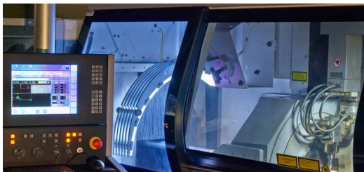
Die Rohrspezialisten von ProfilaseRichter haben mit der TruLaser Tube 7000 Möglichkeiten, die viele Kunden noch gar nicht kennen, beispielsweise Knickverbindungen oder auch Positionierhilfen mit Zapfen und Durchbrüchen, die die Montage erleichtern. Durch die Automatisierung der Maschine verringern sich die Durchlaufzeiten und ermöglichen schnelle Lieferungen.

Wir haben die Schweißnahterkennung, die sich beim automatischen Abarbeiten höherer Stückzahlen bezahlt macht und die adaptive Spanntechnik zur Bearbeitung offener Profile. Ein großes Thema ist auch die Minimierung von Schlackespritzern in Rundprofilen, die wir mit der Spritzschutz-Vorrichtung erreichen. Für die prozesssichere Beladung sorgt ein LoadMaster und die kratzerarme Bearbeitung ist selbstverständlich.