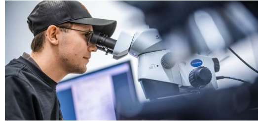
Unermüdlich am Verbessern und Erforschen — das macht Kunden glücklich und wurde 2023 mit dem Bayerns Best 50 Award prämiert.