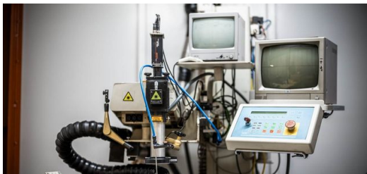
Was überzeugt, bleibt im Einsatz. Gleichzeitig investiert BBW regelmäßig in die aktuellsten Laseranlagen auf dem Markt und erweitert sein Portfolio stetig.