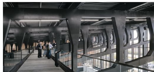
Elf Stahlprofile, aus Einzelstücken geschweißt, tragen das Dach der Produktionshalle der TRUMPF Smart Factory in Chicago, USA.