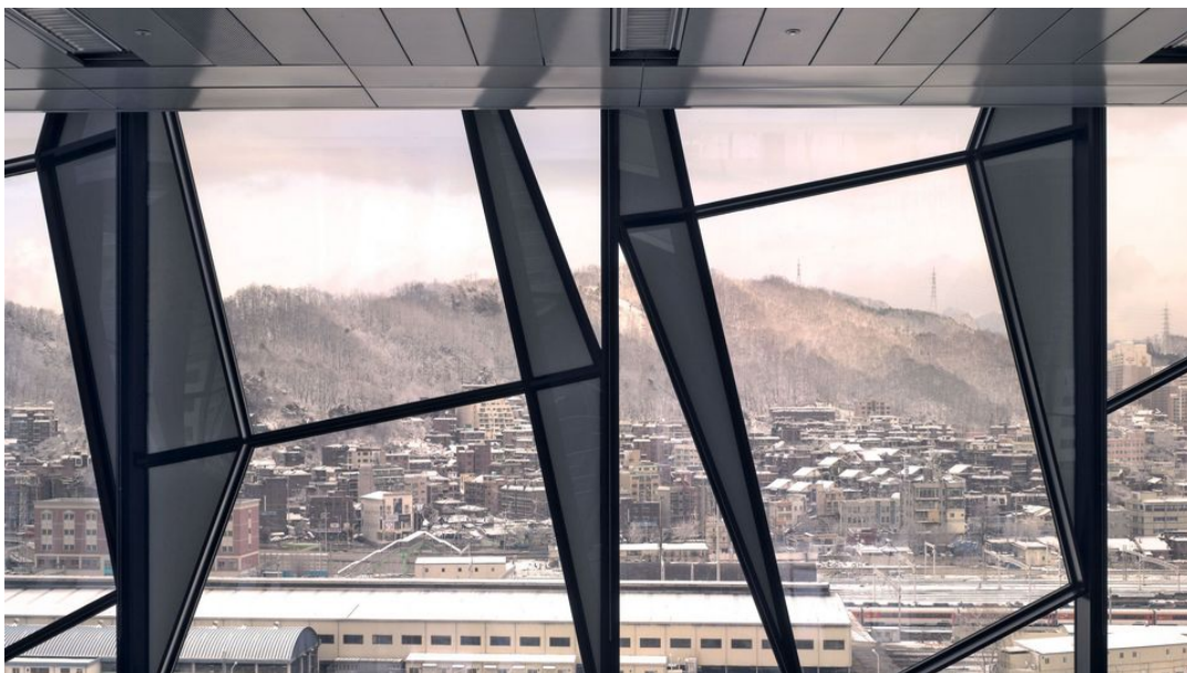
TRUTEC Building in Seoul, Korea.

Wie also bekommt Montanstahl die heiß begehrten scharfen Kanten bei großen Stahlprofilen hin? Beispiel scharfkantige Rechteckhohlprofile: Sie sind als Trägerstruktur für Fassaden beliebt. Konventionell entstehen sie, indem Metallbauer einen Blechstreifen zum Viereck biegen und auf einer Seite schweißen. Der Nachteil beim Biegen zeigt sich an den Außenradien, für die die altbekannte Faustregel gilt: zweimal Materialstärke. Bei Profilen mit 20 Millimeter Wandstärke bekommt man also einen Außenradius von 40 Millimetern – das sind dann keine Rechteckhohlprofile mehr, sondern irgendetwas Eiförmiges. Alternativ kann man auch vier Blechstreifen nehmen und an allen Seiten schweißen. Das hat den zusätzlichen Charme, dass man verschiedene, genau an die Statik angepasste Materialstärken verwenden und somit Stahl sparen kann. Der Haken: Die Vierblechmethode ist extrem teuer und zeitaufwendig. Es sei denn, man macht es wie Montanstahl und setzt auf schnelle, tiefe und hoch belastbare Laserschweißnähte. Damit werden scharfkantige Rechteckhohlprofile so wirtschaftlich, dass sie für immer mehr Bauvorhaben überhaupt erst infrage kommen.