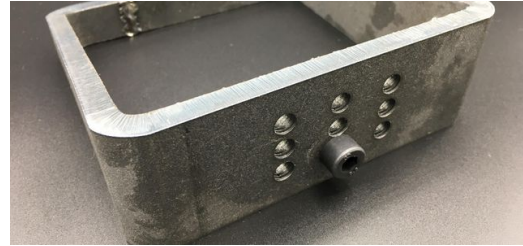
Mit der TruLaser Tube 7000 lassen sich verschiedene Gewinde einbringen.