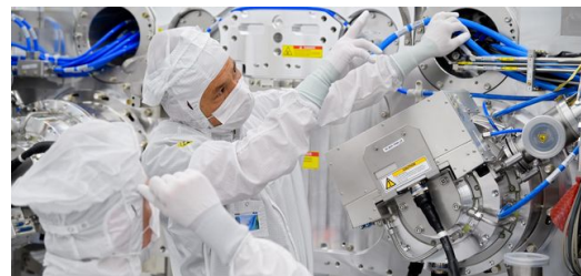
ASML-Mitarbeiter im Reinraum des Unternehmens in Veldhoven, Niederlande.