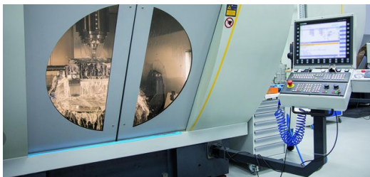
Eine Zeiss-Anlage schleift Spiegel für die EUV-Produktion.