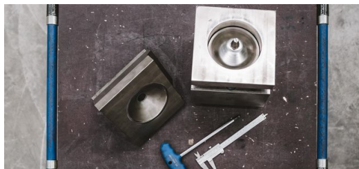
<p>Das von TRUMPF in Pasching speziell für PNH angefertigte Sonderwerkzeug ermöglicht das automatische Einbringen von halbmondförmigen Vertiefungen für die Kesselblechfertigung.</p> – Stefan Fuertbauer