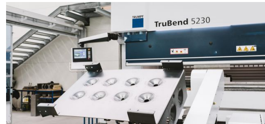
<p>Für die Kesselblechfertigung müssen halbschalenförmige Vertiefungen ins Blech eingebracht werden. Zunächst eine harte Nuss für die TruBend Cell 5000. Heute bewältigt die Biegezelle die Umformung vollautomatisch und spart damit eine Menge Zeit.</p> – Stefan Fuertbauer