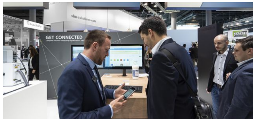
Alle 3D-Drucker des Messestands sind an ein digitales MES angebunden.

Ein weiteres Highlight am TRUMPF Stand war der Digitalisierungsshowcase. Besucher erlebten, wie sich die Prozesskette im 3D-Druck vollständig digital abwickeln lässt. Dafür hat TRUMPF alle 3D-Drucker des Messestands an ein Fertigungsmanagementsystem (MES) und eine intelligente Bestellplattform angebunden. Der Anwender lädt die Daten seines Bauteils hoch und erfährt sofort, was sein Auftrag kostet und wie lange die Lieferung dauert. Aber das ist noch nicht alles. Auch der Hersteller kann auf die Prozessdaten der Drucker und die anstehenden Aufträge zuzugreifen. Und zwar von jedem beliebigen Standpunkt aus und in Echtzeit.