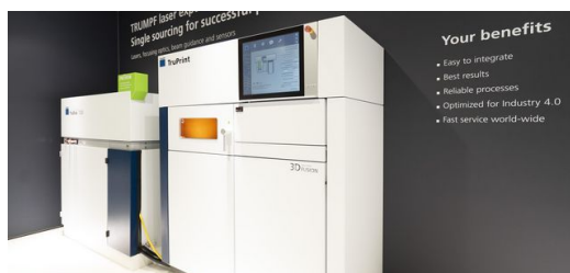
Mit einem neuen grünen Laser druckt TRUMPF Kupfer und Gold

Außerdem hat TRUMPF auf der Formnext mit einem grünen Laser erstmals Reinkupfer und Gold gedruckt. Dazu haben die Entwickler den neuen Scheibenlaser TruDisk 1020 an den 3D-Drucker TruPrint 1000 angebunden. Dessen Wellenlänge liegt im grünen Bereich und kann - anders als Infrarotlaser - stark reflektierende Werkstoffe wie Reinkupfer und Gold schweißen. Wer profitiert davon? Die Schmuckindustrie, weil sie kein teures Material verschwendet. Auch die Elektronikbranche und die Automobilindustrie können Bauteile aus Reinkupfer gut gebrauchen. Schließlich ist das Material ein ausgezeichneter Strom- und Wärmeleiter.