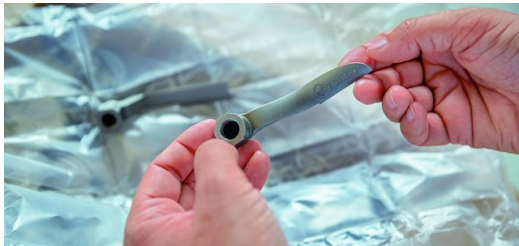
Aus einem Guss: Weich geschwungen und ohne harte Übergänge kommt die von Bionic Production überarbeitete Düsenkonstruktion aus dem 3D-Drucker.

Effizient ist die neue Düse in vielerlei Hinsicht. Sie ist strömungsoptimiert, wodurch sich die Druckverluste um bis zu 20 Prozent reduzieren ließen. Für eine vorgegebene Austrittsgeschwindigkeit des Kühlschmiermittels wird weniger Druck und damit weniger Energie benötigt. Die geschwungenen Kanäle und die optimierte Strahlführung bringen den Kühlschmierstoff zudem exakt dorthin, wo er gebraucht wird, und zwar nur in der Menge, die notwendig ist, damit der Prozess optimal und ohne thermische Beschädigung des Bauteils durchgeführt werden kann. Eine Verlangsamung des Fertigungsverfahrens ist aufgrund der sicheren automatisierten KKS-Einbringung kein Thema mehr.