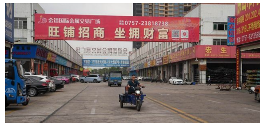
Die Fochon Road im südchinesischen Foshan erwacht früh am Morgen: Hier liegen die großen Materialmärkte der Stadt, viele Geschäfte reihen sich aneinander.