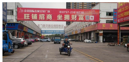
Die Fochon Road im südchinesischen Foshan erwacht früh am Morgen: Hier liegen die großen Materialmärkte der Stadt, viele Geschäfte reihen sich aneinander.