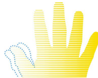
Karl Deisseroth wagt den Selbstversuch mit einer transkraniellen Magnetstimulation. Sein Daumen zuckt.