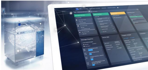
TruDisk Scheibenlaser erfassen Daten aus Lasern, Bearbeitungsoptiken und Prozesssensoren.

Ergänzend zum Expertenwissen von TRUMPF sind die sogenannten Smart View Services im Einsatz: Mit den komfortablen Liveübersichten in einem zentralen Kundenportal können die Mitarbeiter viele kleine Auffälligkeiten selbst erkennen und beheben. Der aktuelle Zustand der Anlage ist weltweit jederzeit auf einem PC-Monitor oder Handydisplay abgerufen werden. Ergebnis: eine signifikant höhere Verfügbarkeit der Laserschweißanlage.