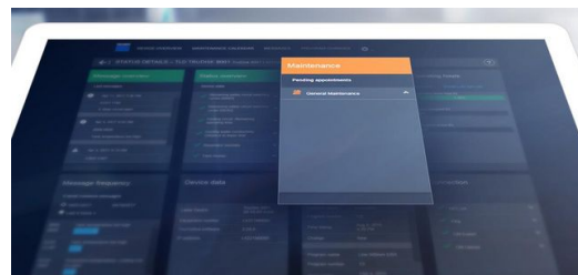
Alle von den Lasersystemen weitergegebenen Daten sind Daimler bekannt und werden sicher verschlüsselt übertragen.