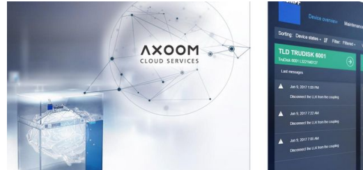
Ein ausgewählter Teil wird über das Internet an die AXOOM Cloud weitergeleitet.