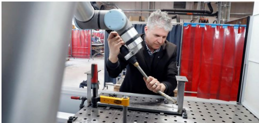
Die TruArc Weld 1000 ist für die Firma zweifel metall ag der Einstieg ins einfache Schweißen.