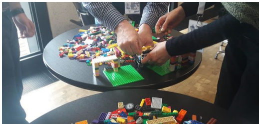
<p>Während der Sprints wühlen wir in den Lego-Haufen, anschließend beurteilen wir im Review unsere Bauwerke.</p> – TRUMPF