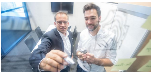
Denken „in 3D“ will gelernt sein. Konstrukteure müssen sich von klassischen Regeln wie „man kann nicht um die Ecke bohren“ lösen und