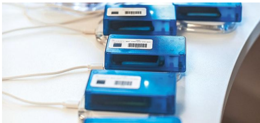
Prototyp: So sahen die Marker während der Testphase aus.