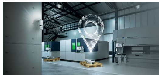
So können Blechfertiger Aufträge, Ladungsträger und Transportmittel nachverfolgen und dadurch Prozesse optimieren.