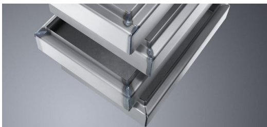
Klemmenkasten aus Baustahl (von unten nach oben): ungeschweißt, MAG-handgeschweißt, FusionLine-geschweißt und lasergerecht umgestaltet und lasergeschweißt.

Mit der Funktion FusionLine ist es zudem möglich, Bauteile zu verbinden, die nicht für das Laserschweißen optimiert sind und beispielsweise Spalten aufweisen. Dabei liegen die Ergebnisse von FusionLine in Sachen Schweißnahtqualität und Prozessgeschwindigkeit deutlich über denen konventionell geschweißter Bauteile.