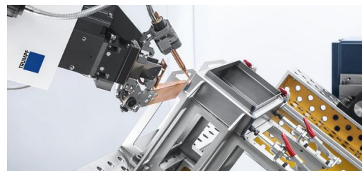
Das neue Verfahren FusionLine verbindet Teile auch dann, wenn Spalte überbrückt werden müssen. Es gleicht Ungenauigkeiten beim Schweißvorgang aus und schließt Spalte mit bis zu einem Millimeter Breite. Viele Bauteile, die für konventionelle Schweißverfahren konstruiert wurden, lassen sich so mit dem Laser bearbeiten.