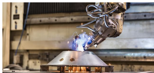
Die Laserzell 1005 nutzt Elfim für unterschiedliche Laseranwendungen wie 2- und 3-D-Schneiden und Schweißen aber auch für das LMD-Verfahren.