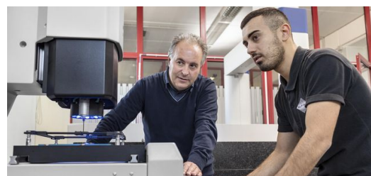
Ersatzteile für Oldtimer sind rar. Per LMD-Verfahren lassen sie sich kostengünstig rekonstruieren. Dafür scannen die Experten bei Elfim die Ersatzteile ein.