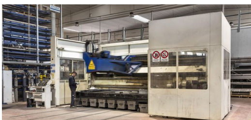
Multitalent: Mit der Laserzell 1005 schweißt und schneidet ELFIM nicht nur 2-D- und 3-D-Bauteile, sie eignet sich auch fürs Laserauftragsschweißen.

Dabei handelt es sich fast immer um Einzelstücke, 12 Stück waren bisher das größte Los für ELFIM: „Mit dem LMD-Verfahren fertigen wir Komponenten, die sich entweder nicht anders herstellen lassen oder deren Produktion mit alternativen Verfahren bei so kleinen Losgrößen viel zu teuer wäre. Zum Beispiel weil man vorher erst aufwendig eine Gussform oder andere Werkzeuge bauen müsste“, erläutert D’Alonzo.