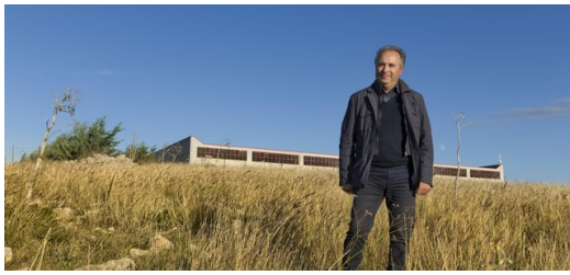
Das Unternehmen ELFIM S.r.l. befindet sich auf einer kargen Hochebene bei Gravina in Puglia.

Und hier treffen sich in Süditalien wieder Vergangenheit und Zukunft, denn eines der ersten und bis heute wichtigsten LMD-Anwendungen sind Ersatzteile für Oldtimer. Für die gibt es natürlich keine Computermodelle. In solchen Fällen scannen die Experten bei ELFIM ein existierendes Ersatzteil mit dem 3D-Scanner ein, modifizieren hier und da noch etwas und erhalten dann ein dreidimensionales CAD; ein Vorgang, den man Reverse Engineering nennt. Bei anderen Aufträgen bekommen sie bereits die fertigen Daten für die Produktion. So wie bei den Turbinenschaufeln.