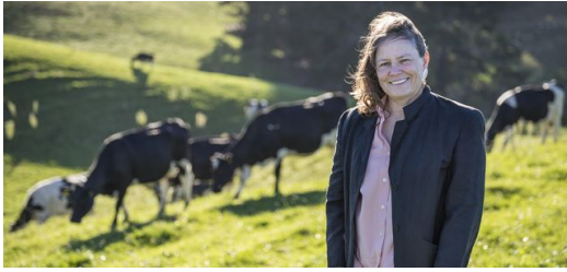
Prof. Cather Simpson auf einer Weide nahe Auckland. Sie weiß, dass der Markt für künstliche Befruchtung 1,5 Milliarden US-Dollar allein für die Milchviehwirtschaft beträgt.