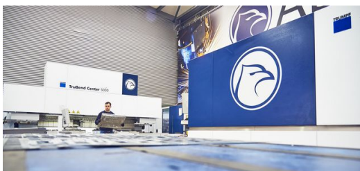
<p>Modernerste Technologie: Arbeiter mit der TruBend Center 5030</p>