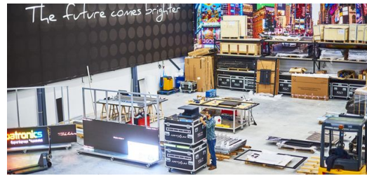
<p>Individuell: Apametal entwickelt und baut jedes digitale Schild selbst.</p> – Frederik Dulay-Winkler