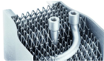
<p>Kann man den Wärmetauscher selbst drucken spart man Zeit und Kosten im Entwicklungsprozess.</p> – Philipp Reinhard