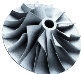
<p>LMF hat sich im Automobilbau vor allem bei Strömungsmaschinen und Wärmeüberträgern etabliert.</p> – Philipp Reinhard