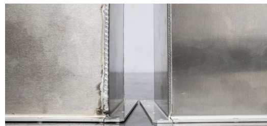
Werner Neumanns Erwartungen in punkto reduzierter Nacharbeit hat das Laserschweißen voll und ganz erfüllt. Bei manchen Teilen konnte er sie von zwölf auf eineinhalb Stunden reduzieren.