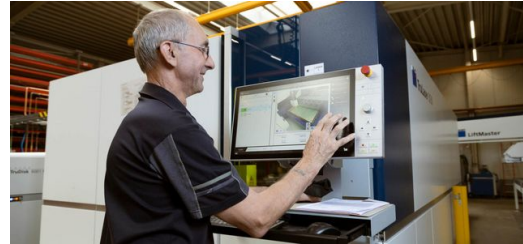
Eine TruLaser 3030 wird mit einem LiftMaster teilautomatisiert be- und entladen.