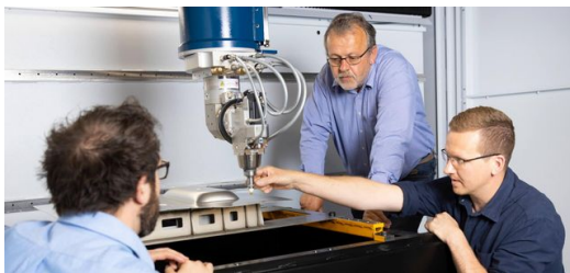
Miteinander diskutieren, streiten und gemeinsam Lösungen suchen: die gute Zusammenarbeit zwischen Söhnen und Vater hat das Unternehmen weit vorangebracht, mit Kurs auf die Smart Factory.