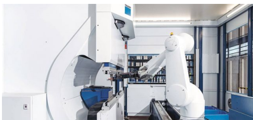
Innovative Highspeed-Biegezone: Die TruBend Cell 7000 ist ein kompaktes System, mit dem sich Kleinteile hochdynamisch und wirtschaftlich biegen