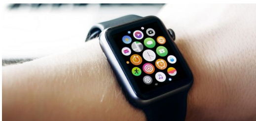
Die Smart Watch ist ein weiterer intelligenter Alltagsbegleiter.

Diese neue Glasschneidemethode bietet dabei nicht nur die Chance, die heutige industrielle Displayproduktion von teuren Zwischenschritten zu befreien. Auch die Prozessreihenfolge ließe sich neu anordnen: Weil der Laser gehärtete Gläser schnell und nachbearbeitungsfrei zerlegt, könnten künftig die üblichen Bearbeitungsschritte — Härten, Beschichten und Strukturieren — am großen Werkstück ausgeführt werden. Erst am Schluss zerteilt der Laser dann die große Scheibe.