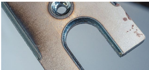
Besonders bei dicken Blechen ist die Technologie enorm hilfreich: Mit EdgeLine Bevel lassen sich Blechdicken von bis zu acht Millimetern bearbeiten.

Mit EdgeLine Bevel sind neuartige, bislang kaum mögliche Bauteile denkbar. Bisher können Anwender beim Laserschweißen nur dünne Bauteile mit einer Blechdicke bis zu zwei Millimetern biegen und anschließend mit einer Wärmeleitnaht zu einem Bauteil mit runder Sichtnaht ohne Nacharbeit verschweißen. Das Bauteil muss dafür so geschnitten werden, dass das Material, welches der Laser beim Schweißen aufschmilzt, nicht zu weit übersteht. Außerdem sind nur maximal 70 Prozent der verwendeten Blechdicke möglich. Deshalb funktioniert dieses Vorgehen auch nur bei dünnen Blechen. Weist das Bauteil Fasen auf, ist es möglich, mehr Material überstehen zu lassen und somit die Grenze auf drei bis vier Millimeter dickes Blech auszuweiten. Diese neue Möglichkeit beim Laserschweißen eröffnet Konstrukteuren mehr Gestaltungsfreiheit, innovative Bauteile zu erschaffen und den Fügeprozess zu erleichtern.