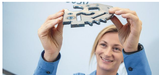
Keine Nacharbeit erforderlich: Mit EdgeLine Bevel erhält das Bauteil eine ebene Oberflächen, denn die Schweißnaht steht nicht über und sitzt somit bündig.