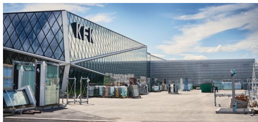
<p>Das KFK Gebäude in Kroatien.</p>