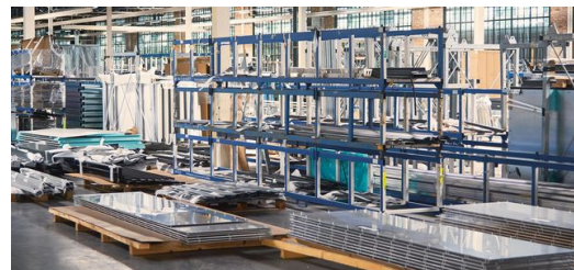
<p>Alles aus einer Hand: Seit 2017 besitzt KFK eine eigene, ca. 360 Meter lange Glasfertigung.</p> – Frederik Dulay-Winkler