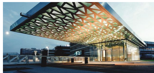
<p>Haupteingang und Empfang: Der Blick zur Decke genügt – Besucher erkennen gleich, dass sich mit TRUMPF Maschinen Bleche lasern lassen. </p>