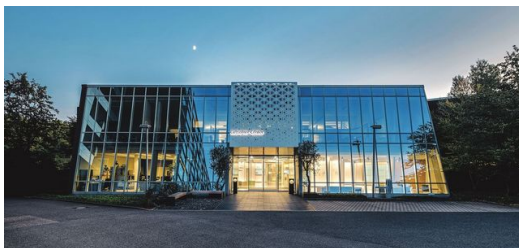
<p>Kundenzentrum: Eine schöne Industriearchitektur in Kombination mit einer hohen Produktqualität soll die TRUMPF Kunden überzeugen. </p>