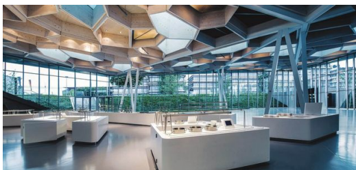
<p>Begegnungsräume: Der Blautopf ist mehr als nur ein Betriebsrestaurant. </p>