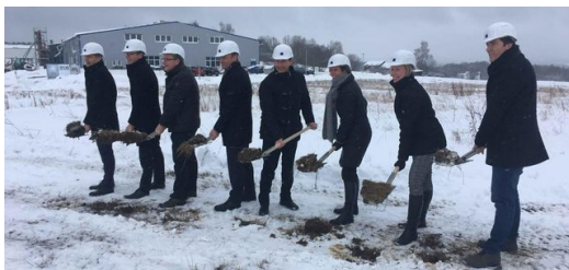
Spatenstich für die neue Produktionshalle am TRUMPF Standort Hettingen im Januar 2019. 120 Mitarbeiter sollen das Kompetenzzentrum in zwei Jahren beziehen.