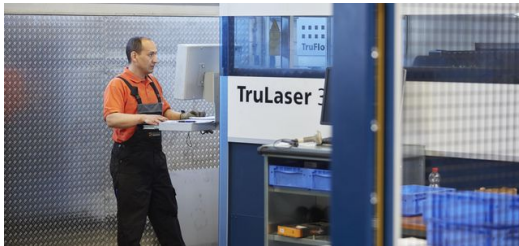
Der PalletMaster Tower wird mit der Standardsoftware der Maschine programmiert und die Bedienung ist einfach.

Neben Schnelligkeit, Flexibilität und Prozesssicherheit entlastet das automatisierte Be- und Entladen des Materials tagsüber auch den Bediener und sorgt für mehr Arbeitssicherheit. „Nachts fahren wir komplett mannlos und in den Tagesschichten sorgt der Tower dafür, dass sich meine Mitarbeiter nicht mehr mit den schweren unhandlichen Großformatblechen abmühen müssen.