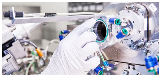
Ein Mechatroniker montiert einen Spiegelhalter.

Also zurück zum Laser: Die Idee hinter dem laserbasierten Herstellungsverfahren liest sich relativ simpel: Ein Zinn-generator schießt 50.000 Zinntropfen pro Sekunde (!) in eine Vakuumkammer, während ein Laserpuls die vorbeirauschenden Tropfen trifft. Bei diesem Hightech-Tontaubenschießen entsteht im Vakuum ein Plasmablitz mit der gewünschten Wellenlänge von 13,5 Nanometer. Im Anschluss fängt ein Kollektor das vom Plasma emittierte EUV-Licht ein, bündelt und übergibt es schließlich an das Lithografiesystem zur Belichtung des Wafers. Um diesen Laserpuls zu erzeugen, hat TRUMPF eine einzigartige Strahlquelle auf Basis seiner CO 2 -Lasertechnologie entwickelt. Der sogenannte TRUMPF Laser Amplifier verstärkt einen schwachen Laserpuls in fünf Verstärkerstufen um mehr als das 10.000-Fache auf über 30 Kilowatt mittlere Leistung, mit einer Pulsspitzenleistung von einigen Megawatt!